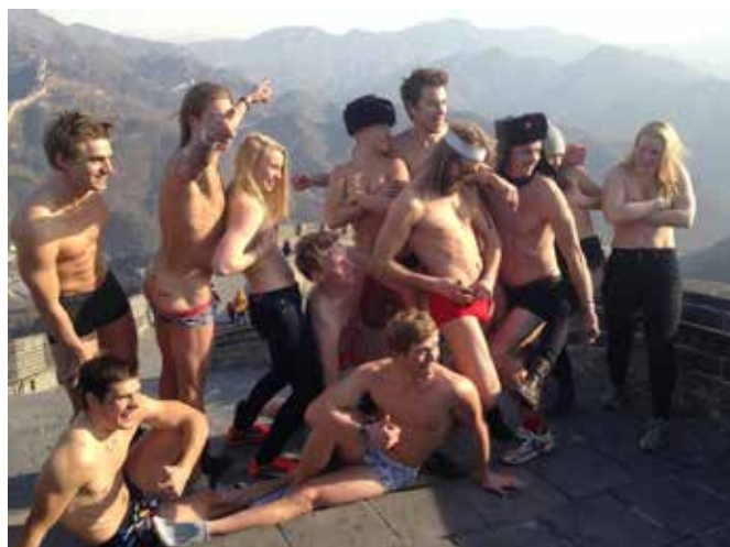
Muren som den aldrig varit förr..